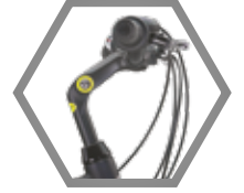
AYARLI GİDON BOĞAZI