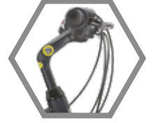
AYARLI GİDON BOĞAZI